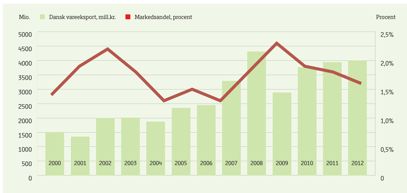
Danmarks vareeksport til Tyrkiet i mio. kr. og sammenholdt med andre EU-landes vareeksport til Tyrkiet, 2000-2011

Kilde: Danmarks Statistik (vareeksporten, SITC2) og Eurostat (markedsandel, CN8)