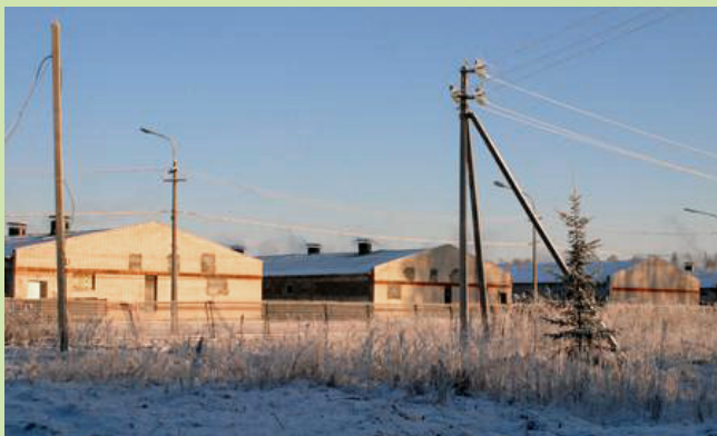
Rurik farmen i Tosno distriktet, Leningrad regionen.