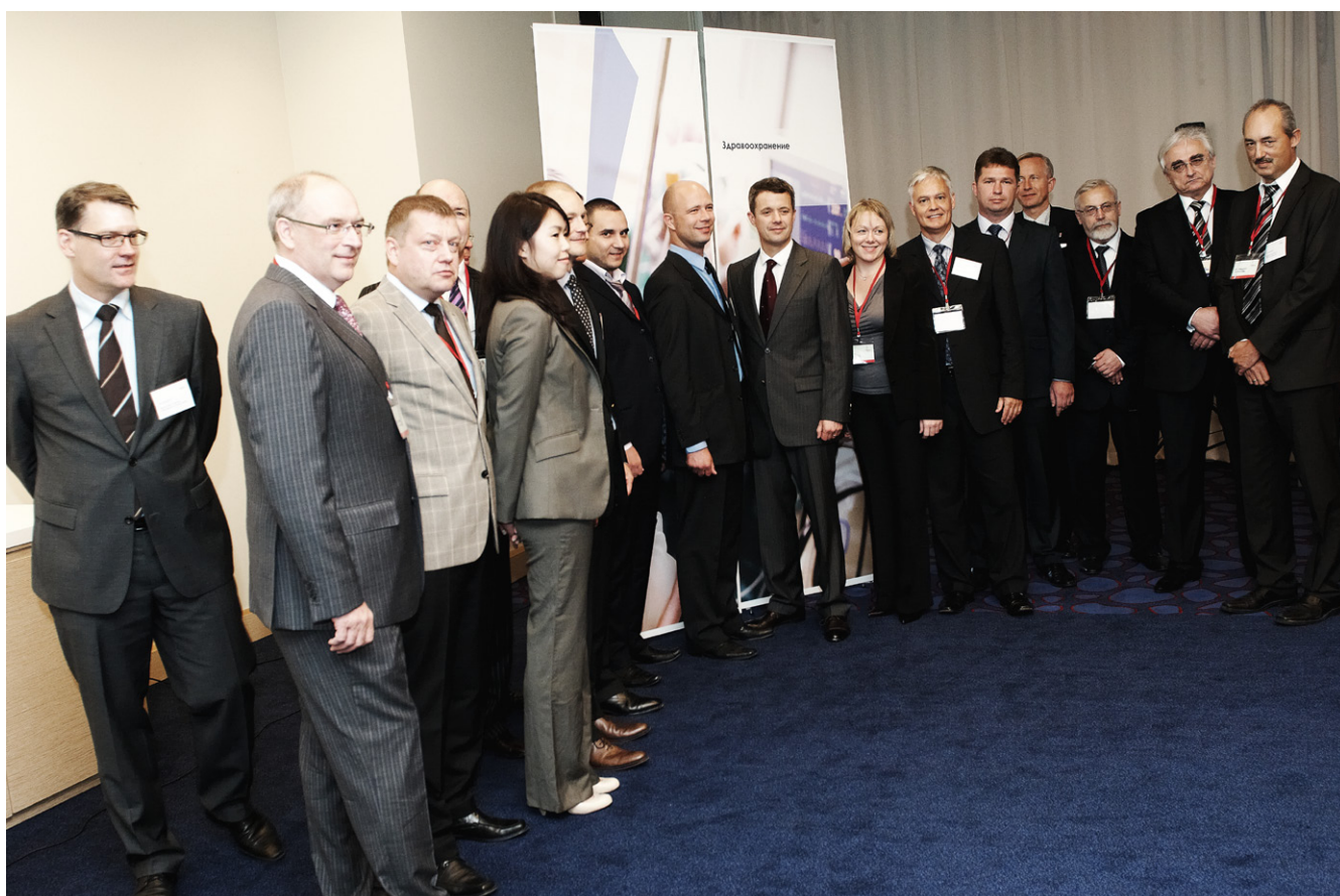
"Modernization in Healthcare" seminar. HKH Kronprins Frederik og repræsentanter for de danske virksomheder under HMD Dronning Margrethes statsbesøg i Rusland i 2011.

Dansk søtransport er en styrkeposition, der i meget høj grad er repræsenteret i Rusland. Dansk søfart står for ca. 27 pct. af den samlede danske eksport til Rusland. Eksportpotentialet vurderes fortsat at være stort i de kommende år i takt med, at Ruslands internationale samhandel stiger.