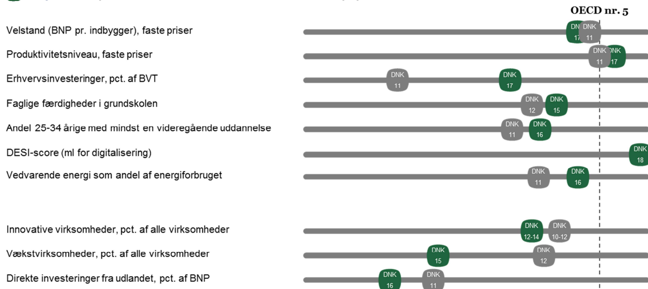
➔ Figur 1 Udvalgte centrale indikatorer for vækstvilkår – Danmark i dag og efter krisen

Anm.: Tal i figuren angiver årstal for opgørelsen af hver indikator for vækst. Indikatorværdierne for "DNK" og "OECD" er skaleret i forhold det femte bedste OECD-land og det dårligst placerede OECD-land, hvor det femte bedste OECD-land er sat til indeks 100 og det dårligst placerede OECD-land er sat til indeks 0. Dermed angiver indikatoren den relative afvigelse fra henholdsvis det femte bedste OECD-land og det dårligst placerede OECD-land. Skalaen i figuren går fra indeks 0 til indeks 110. For nærmere beskrivelse af målemetode og datagrundlag henvises, se appendiks III.