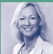
Cecilia Bonefeld-Dahl , generalsekretær i DIGITALEUROPE