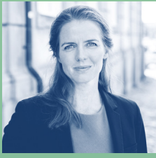
Ellen Trane Nørby , sundhedsminister