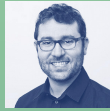
Matt Rogers , Silicon Valley-investor og stifter af Nest og Incite