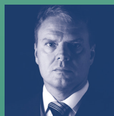
Troels Ørting , chef for Global Centre for Cybersecurity i World Economic Forum