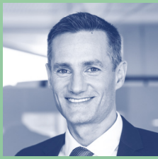
Rasmus Jarlov , erhvervsminister