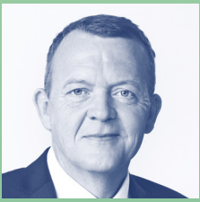
Lars Løkke Rasmussen , statsminister