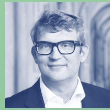
Troels Lund Poulsen , beskæftigelsesminister