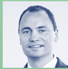
Tommy Ahlers , uddannelses- og forskningsminister