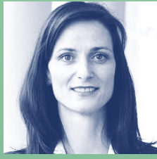
Mariya Gabriel , EU-kommisær for den digitale økonomi og det digitale samfund