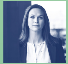
Merete Riisager , undervisningsminister