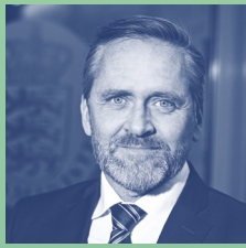
Anders Samuelsen , udenrigsminister