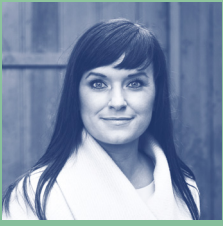
Sophie Løhde , innovationsminister